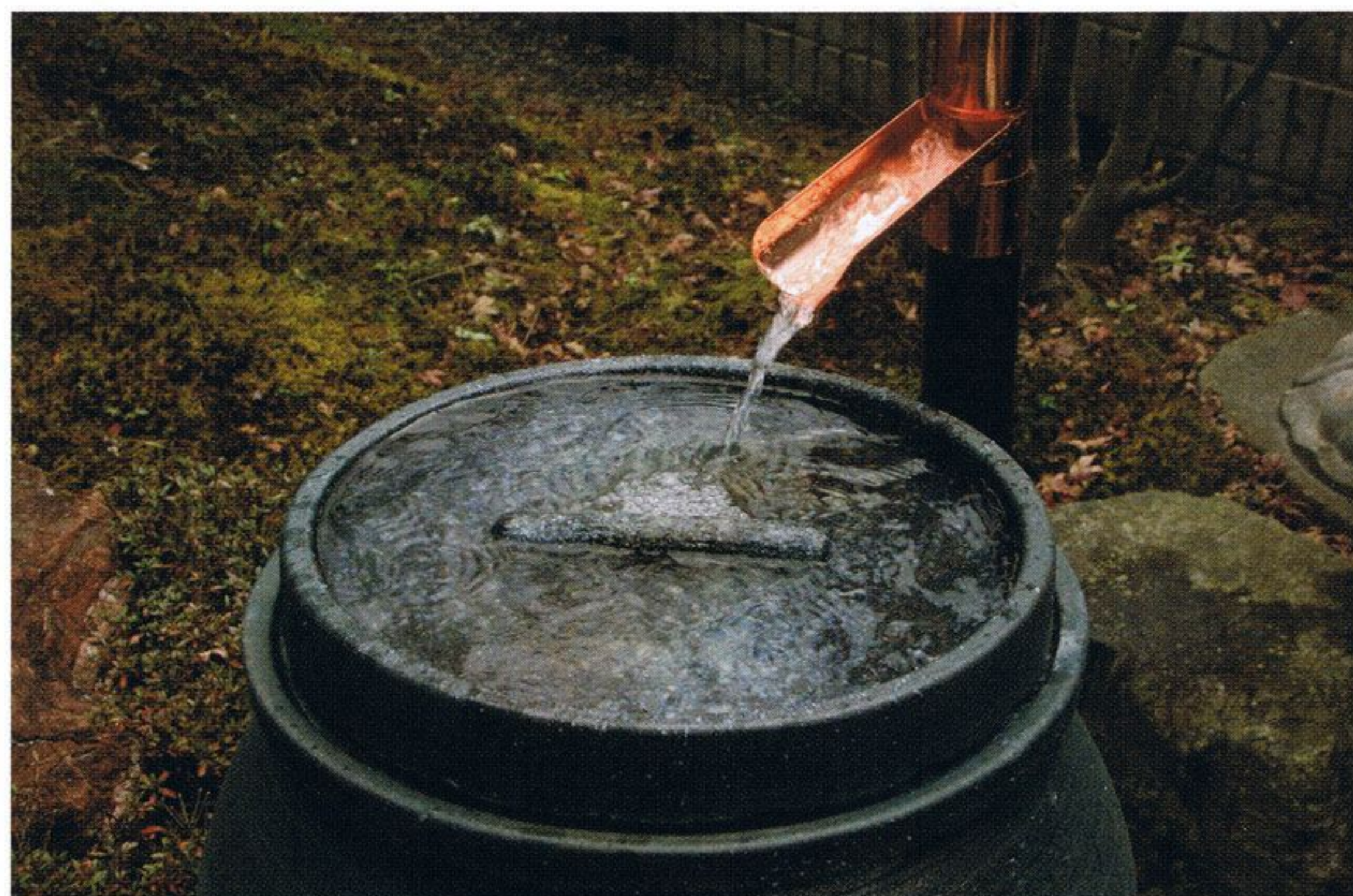
60リットルタイプ JK22-8001 W380×H700 パソコン器具付き