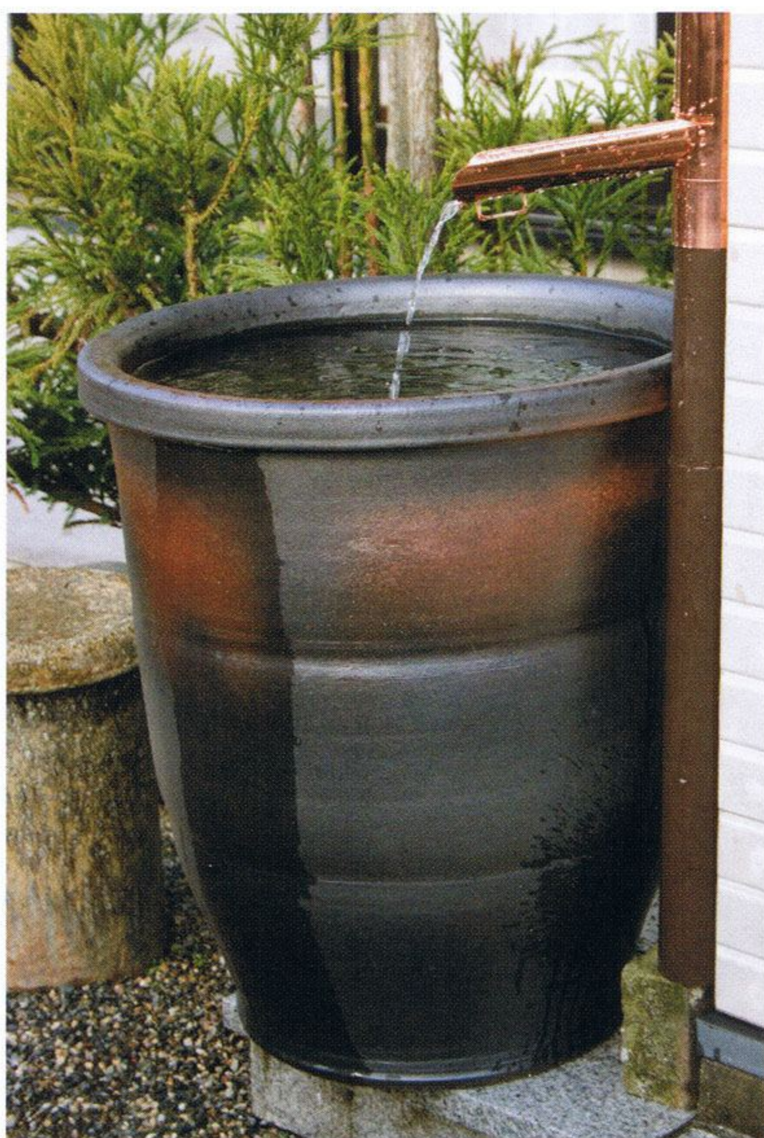
100リットルタイプ JK22-8002 W540×H610 パソコン器具付き ¥160000